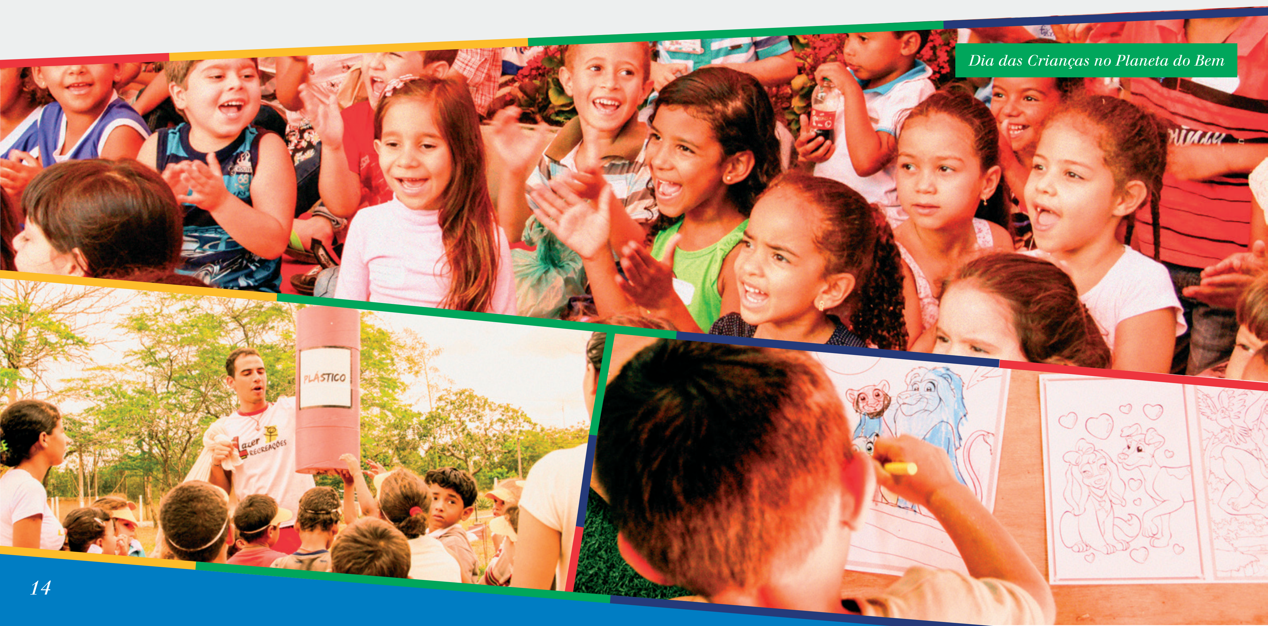
Dia das Crianças no Planeta do Bem

A turma do Planeta do Bem abriu as portas da casa interativa para promover a consciência ambiental em 3.635 alunos de 31 escolas de Belo Jardim, Tacaimbó, Pesqueira, Garanhuns e Caruaru. Para ajudar nas atividades educativas do espaço, 69 alunos de 9 escolas do município participaram da formação de voluntários do Planeta do Bem, que também ofereceu um workshop envolvendo 18 professores. Dezesete monitores voluntários do Planeta do Bem e 4 técnicos do ICM também tiveram uma capacitação por meio de uma aula de campo no Espaço Ciência e na Usina Solar Pernambuco, agregando ainda mais conhecimentos. O Planeta também foi palco para o evento do Dia das Crianças, que envolveu 600 pequenos com muita diversão e aprendizado.