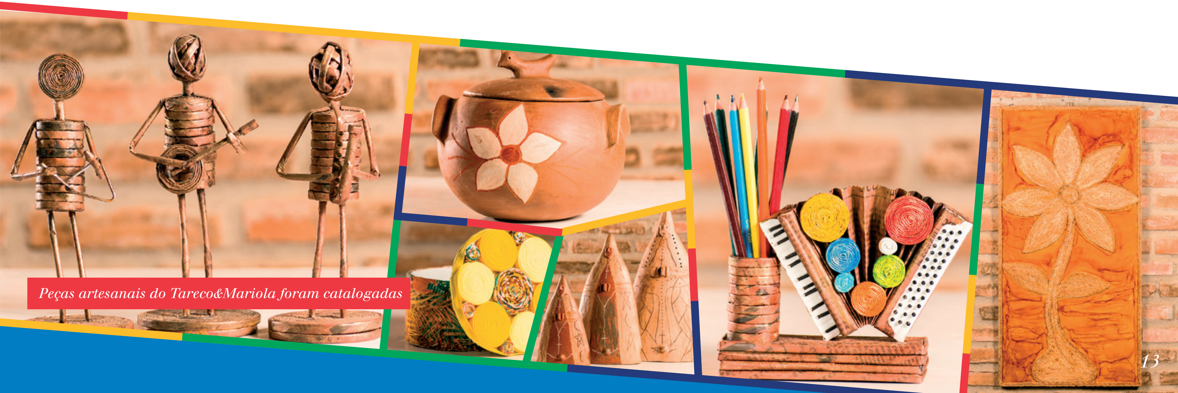
Peças artesanais do Tareco&Mariola foram catalogadas

O artesanato gera renda e mantém viva a tradição do fazer com a mão. Por isso, o ICM buscou fortalecer ainda mais a organização dos artesãos. Por meio de parceria com o Sebrae, apoiou a formação de uma associação de artesãos e realizou consultorias e cursos no campo do empreendedorismo e planejamento empresarial. O Centro de Artesanato fechou o ano com 40 artesãos cadastrados, que viabilizaram a comercialização dos seus produtos no local. No total, quase 4 mil produtos foram vendidos em 2015, gerando aproximadamente 50 mil reais em vendas. O Centro modernizou seus processos e agora tem todos os produtos catalogados e expostos nas redes sociais. E, mais uma vez, a Fenearte, a maior feira artesanal da América Latina, foi uma importante janela para a produção do Tareco e gerou um resultado financeiro de quase 14 mil reais.